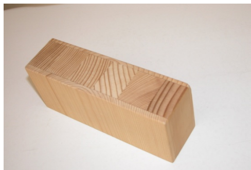
Querschnitt durch das Türfries