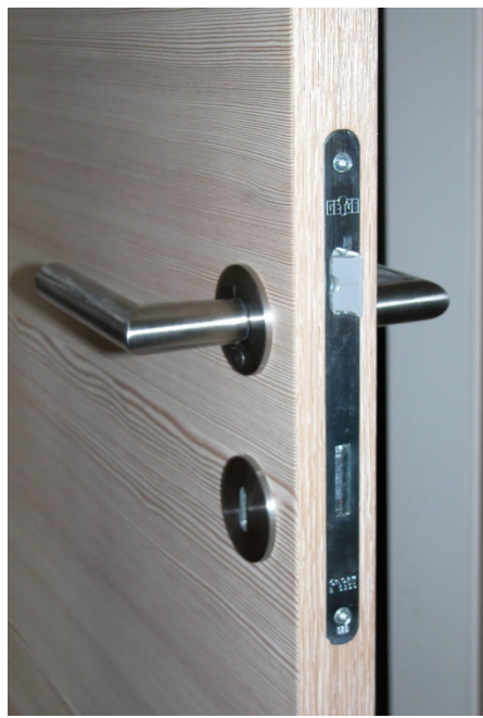
Schloss mit Silencio Kunststoffalle "wartungsfrei und leise"