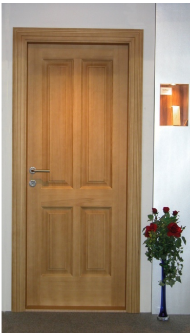
Ansicht Rahmentürblatt Mod. Tirol

Beschläge: je 2 starke 3-D Bänder höhenverstellbar, (Tragkraft 60 kg) mit Aufsteckhülsen, Schließblech verstellbar für variablen Anpressdruck, Schloss mit Silencio Kunststoffalle "wartungsfrei und leise".