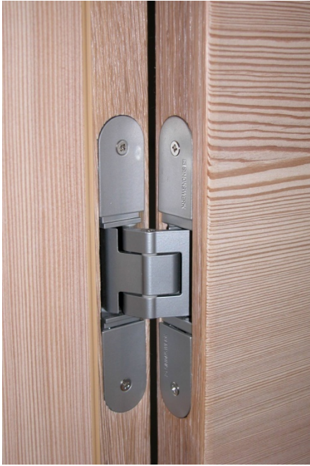
Verdeckt liegende 3-D Bänder (Tektusbänder ) bis 120 kg Tragkraft