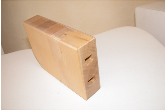
Detail: Querschnitt durch das Türblatt