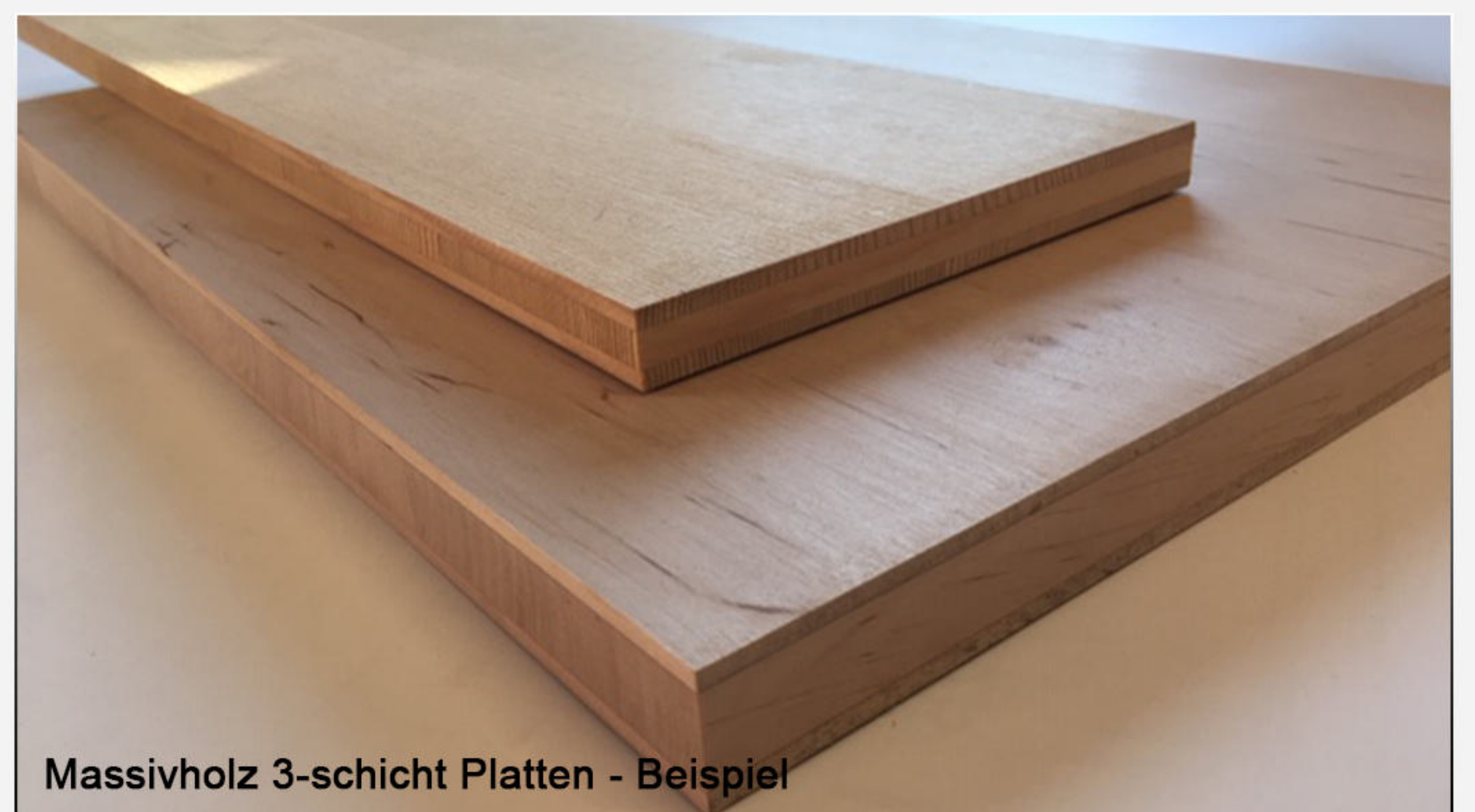
Massivholz 3-schicht Platten - Beispiel