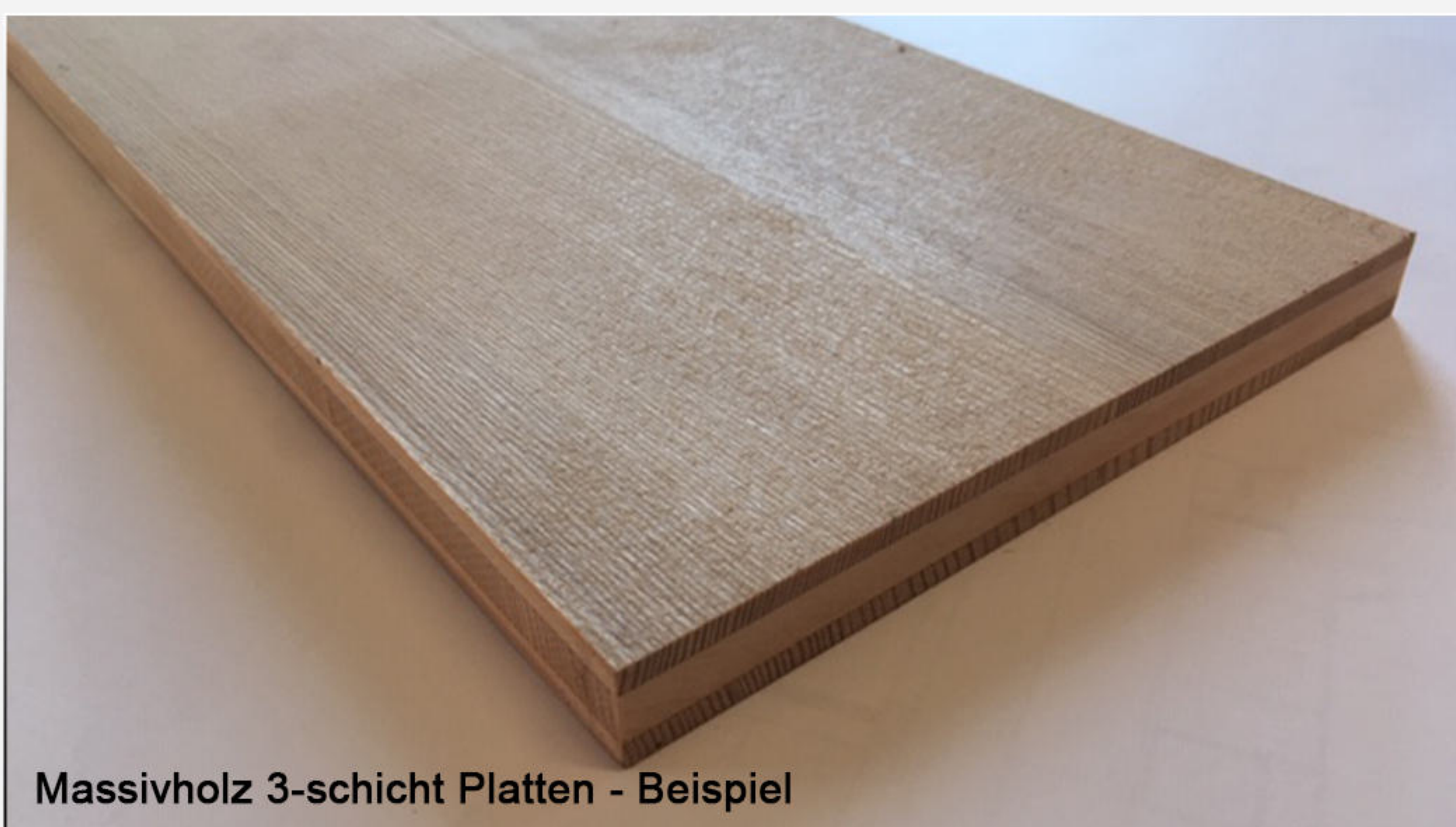
Massivholz 3-schicht Platten - Beispiel