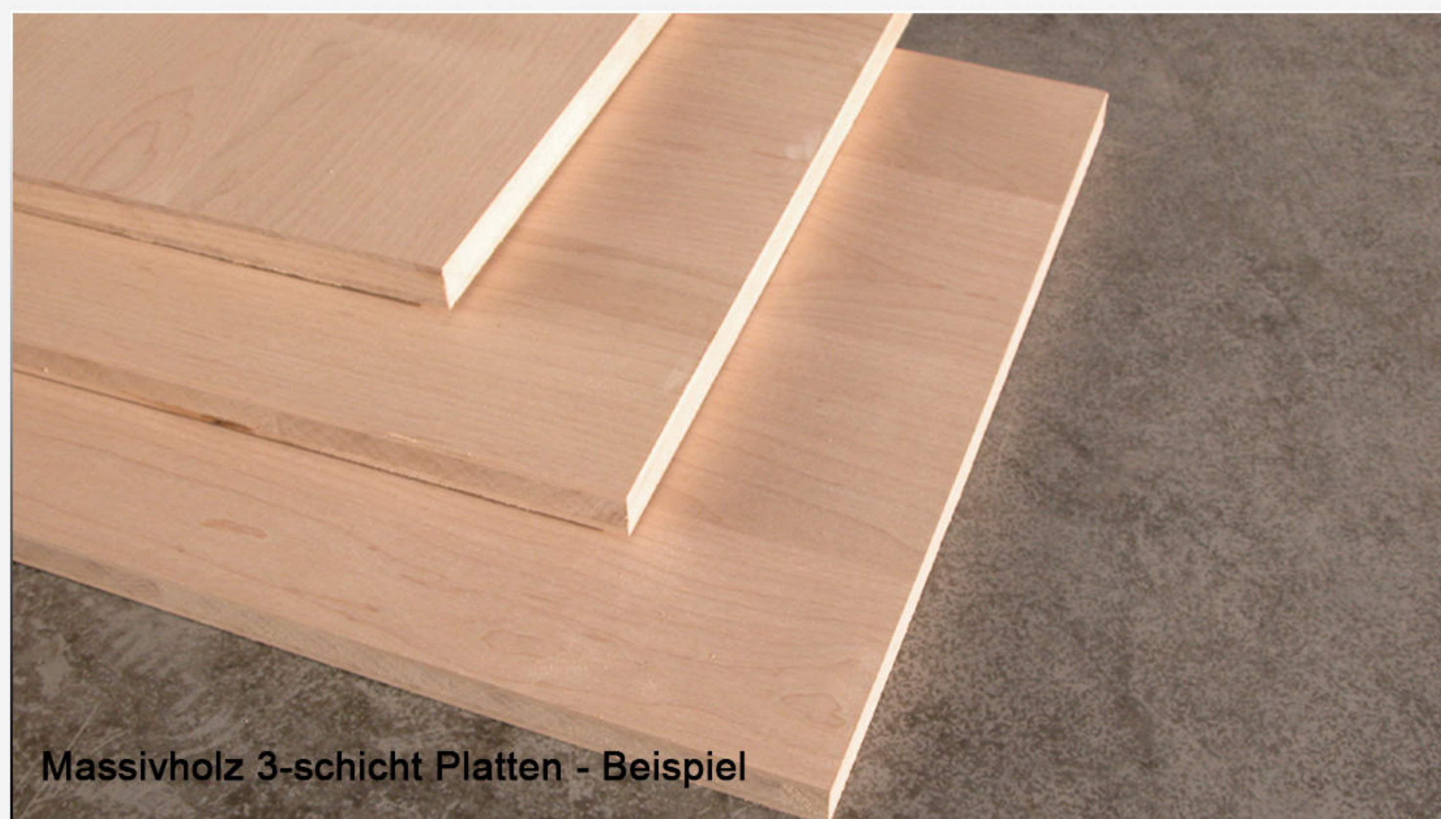
Massivholz 3-schicht Platten - Beispiel