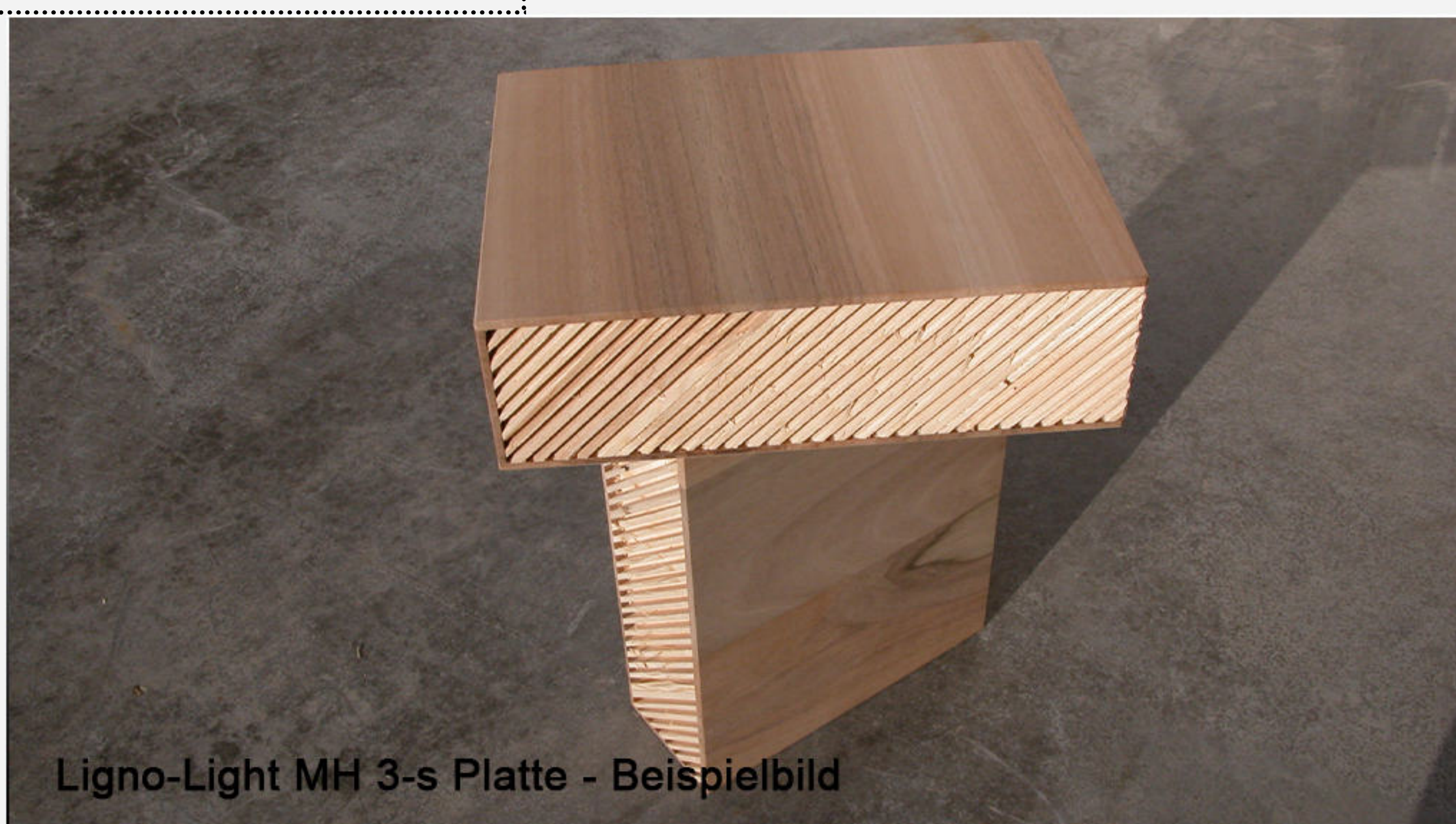
Ligno-Light MH 3-s Platte - Beispielbild