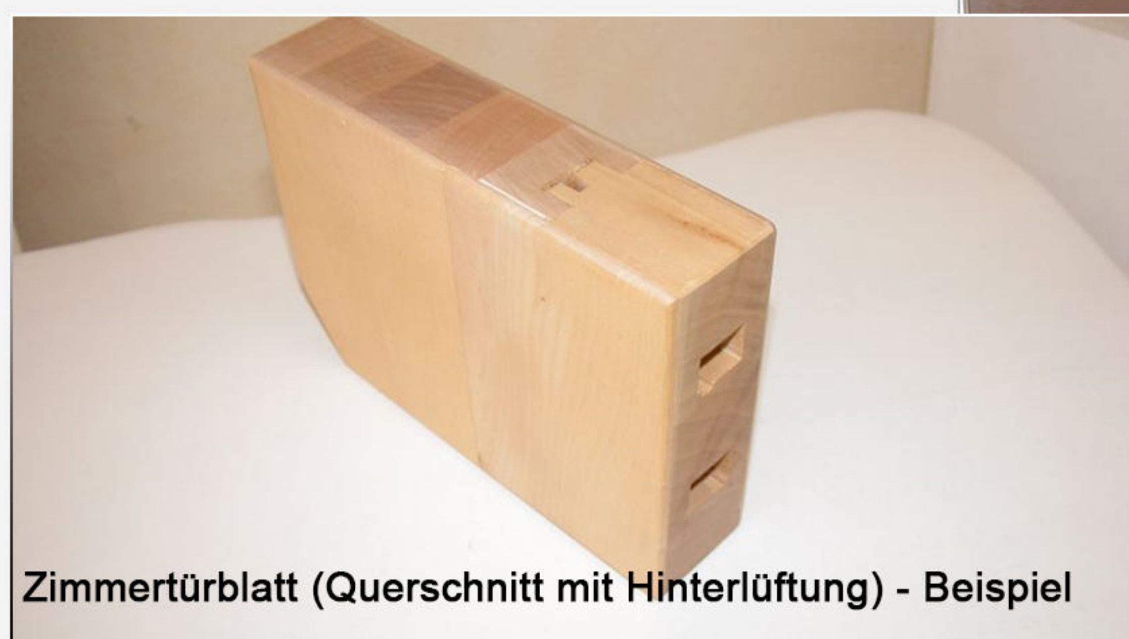
Zimmertürblatt (Querschnitt mit Hinterlüftung) - Beispiel