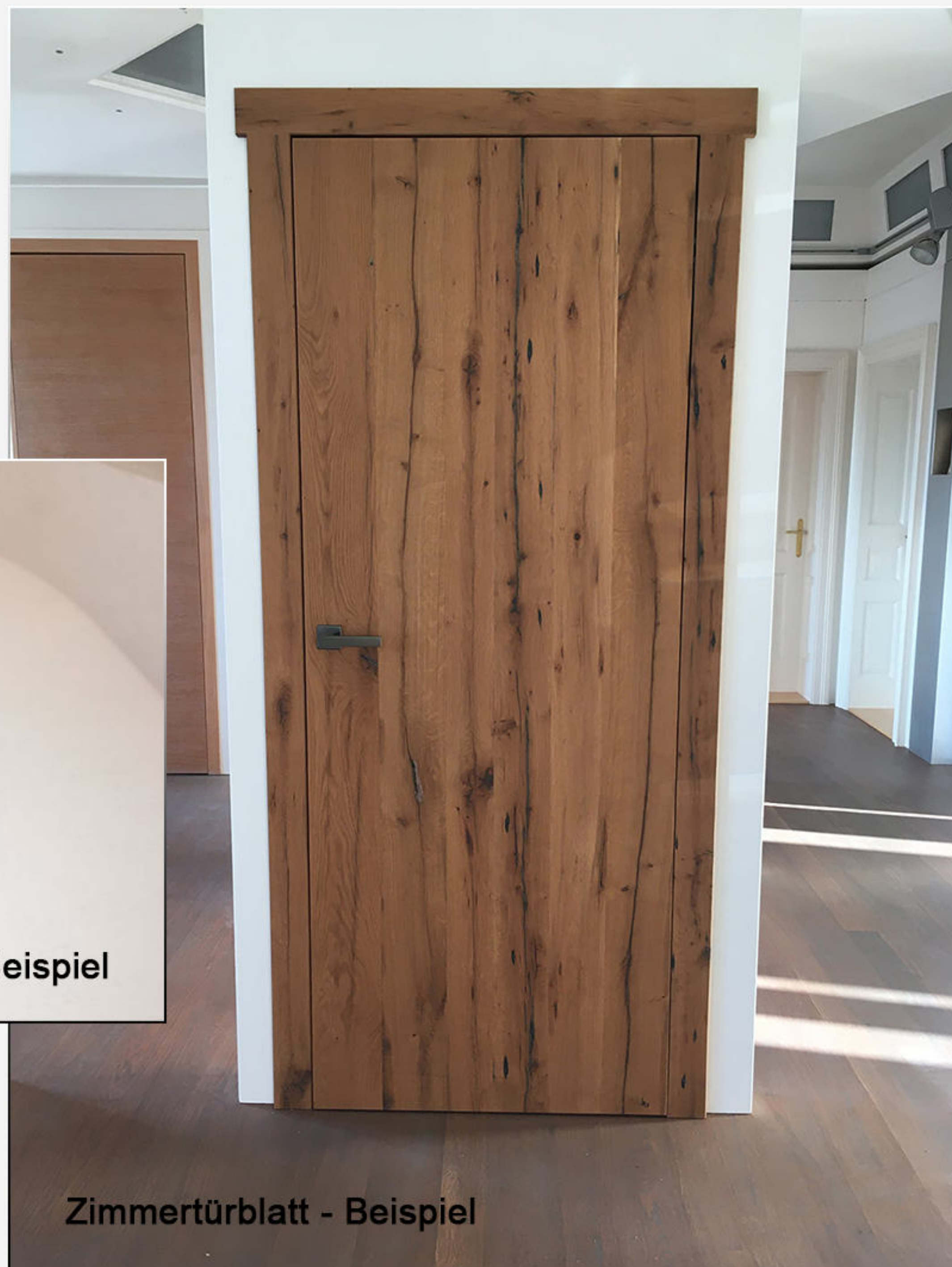
Zimmertürblatt - Beispiel

600 - 700 mm 710 - 800 mm 810 - 900 mm 910 - 1000 mm